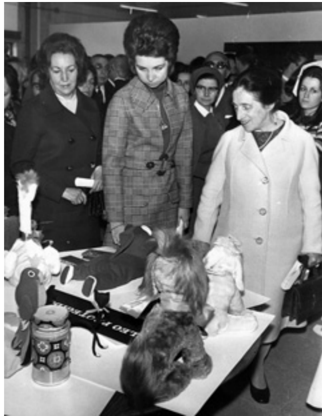
El 14 de abril de 1971, la Princesa Sofia visita nuestra sede central