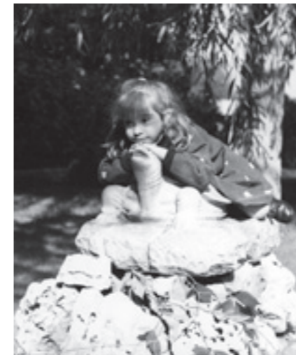
Una niña se apoya en nuestra mascota, la tortuga con alas que se encuentra en Pozuelo