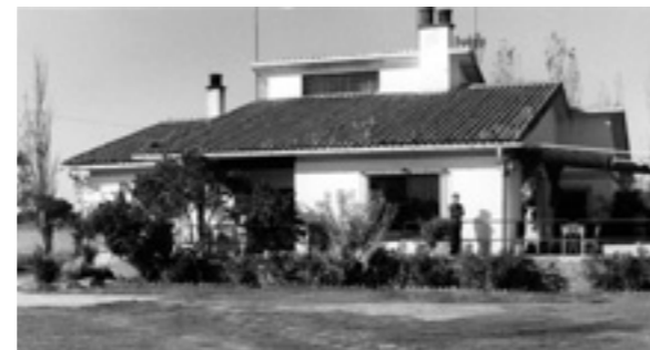
El Cabezo fue el hogar de muchos alumnos de la Fundación