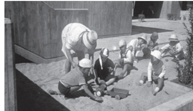
Distintas imágenes de los primeros años del Centro de Pozuelo de Alarcón