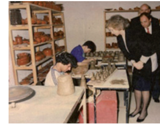
La Reina Sofia visita nuestro centro de la Granja San José

Comenzó a trabajar con la Fundación en 1962 como Trabajadora Social. A partir de 1972 ejerció de psicóloga. De 1977 a 1994 fue directora. Actualmente, es miembro del Patronato de la Fundación. Es un referente importante y representa al sector en los principales organismos nacionales e internacionales perteneciendo durante doce años al Consejo de la Liga Internacional.