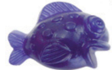
Jabón con Forma de Pez