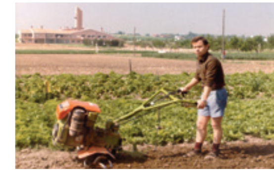
Los primeros años de "La Granja" supusieron mucho esfuerzo