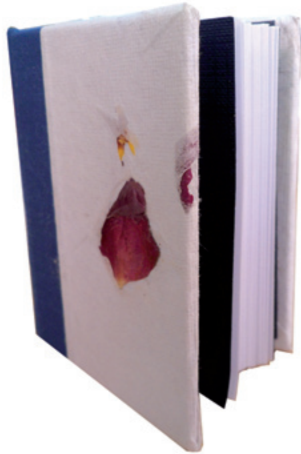
Cuaderno de escritura