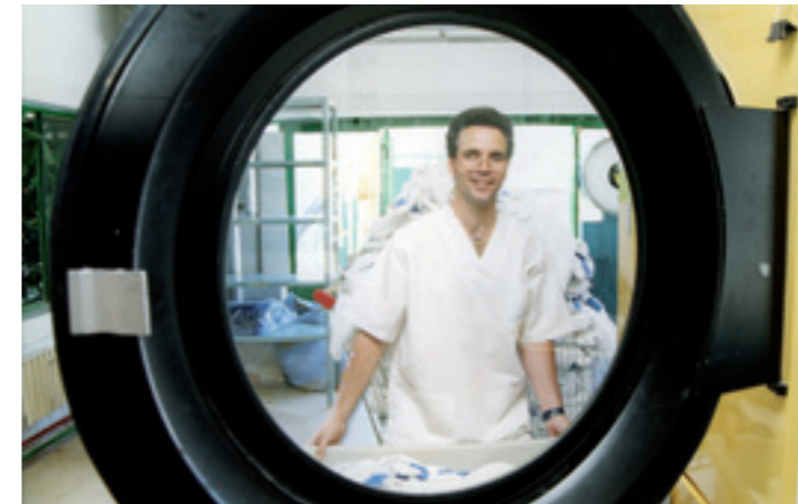
Artesa es un generador de empleo para los miembros de la Fundación