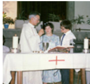
Acto religioso en la Fundación