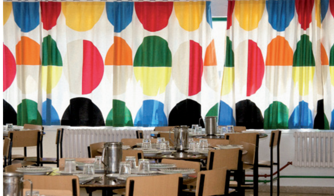
Más de 400 personas utilizan cada día los servicios de comedor de la Fundación

para aquellas personas que no tienen un lenguaje verbal funcional.