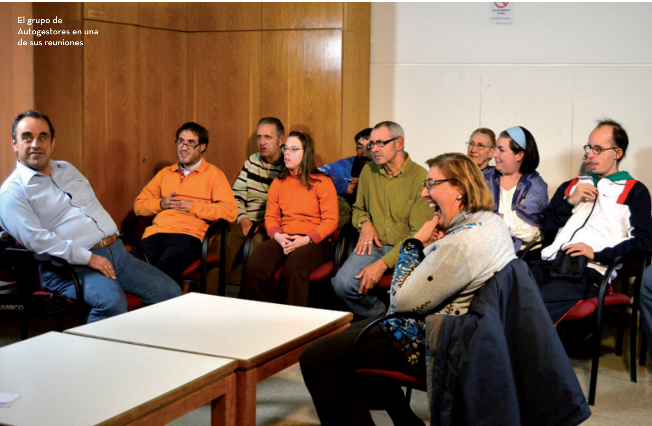
El grupo de Autogestores en una de sus reuniones