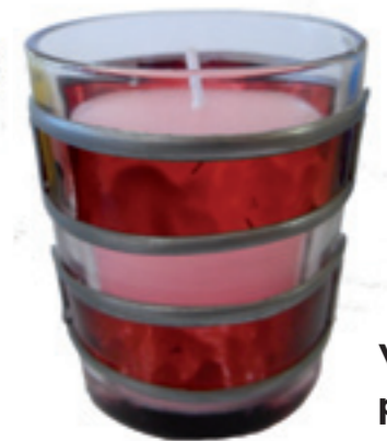
Vasitos para velas