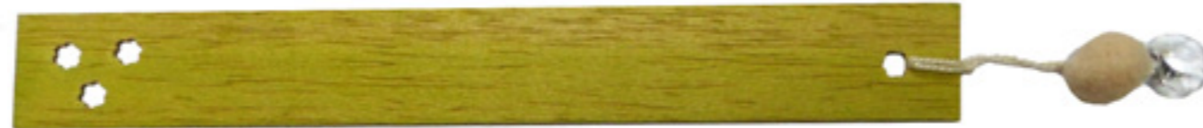
Marcador de libro