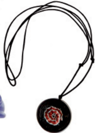
Colgantes de pastilla de Nespresso