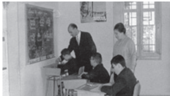
Primeras clases en el Colegio San Luis Gonzaga