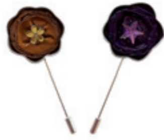
Alfileres de ropa