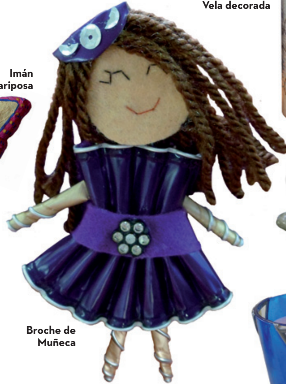
Broche de Muñeca